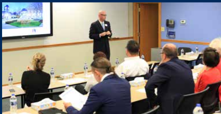
Study Tour, Franklin University

Raz w roku dla słuchaczy programów MBA Wyższych Szkół Bankowych organizujemy wyjazd do USA z autorskim programem dostosowanym do profilu studiów MBA. Plan pobytu w Stanach Zjednoczonych obejmuje m.in. zwiedzanie Franklin University oraz spotkania i warsztaty prowadzone przez przedstawicieli wybranych amerykańskich firm. Słuchacze odwiedzają również wybrane miasta i atrakcyjne obiekty. W 2019 roku na trasie wyjazdu znalazły się też Chicago i Waszyngton. Wyjazd jest dodatkowo płatny – więcej informacji można uzyskać w Biurze Programu MBA.